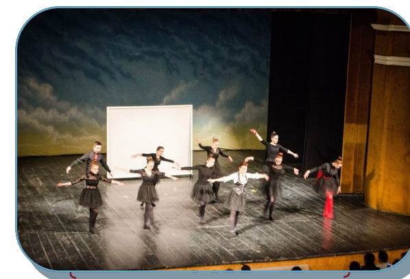
Trupa de teatru "Antract"