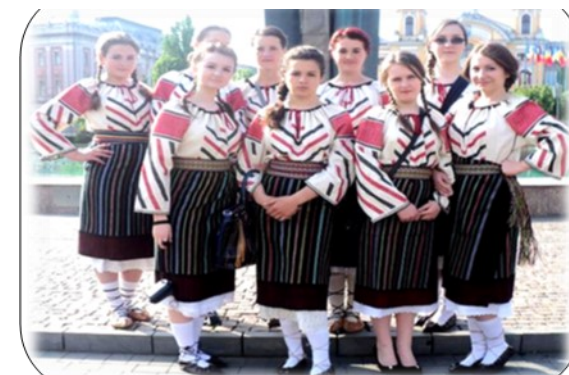
Grupul folcloric "Albăstrița"