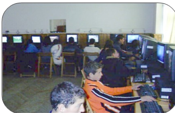
Laboratorul de informatică