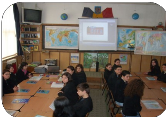
Cabinetul de geografie