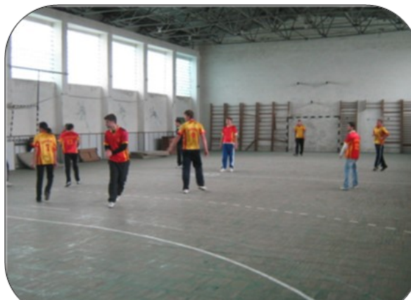
Sală de sport