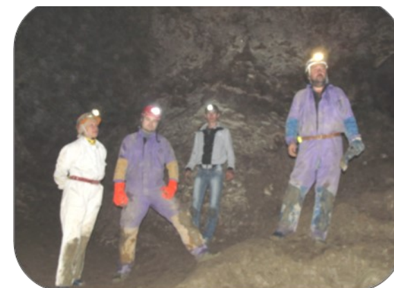
Cercul geografic "Geopolis"